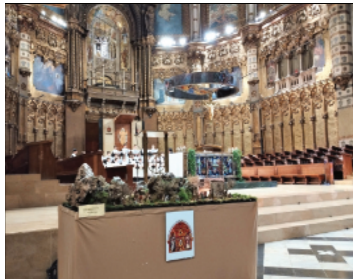
El Pessebre fou col·locat als peus del Presbiteri on romangué tot el Nadal.