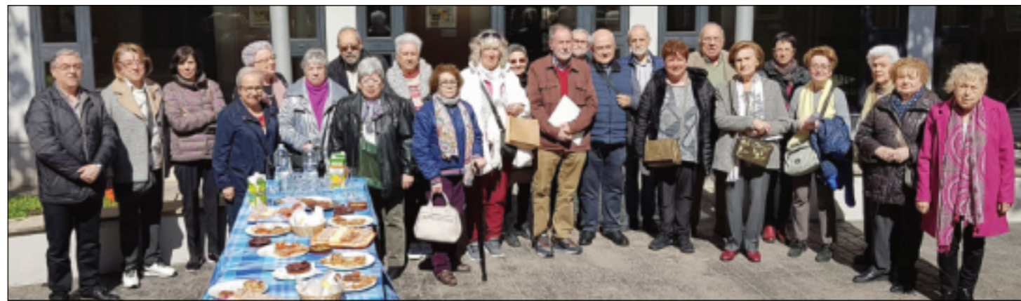
Finalitzada l'Assemblea, els confreres participants van compartir un animat "pica-pica" al claustre de l'Acadèmia Mariana