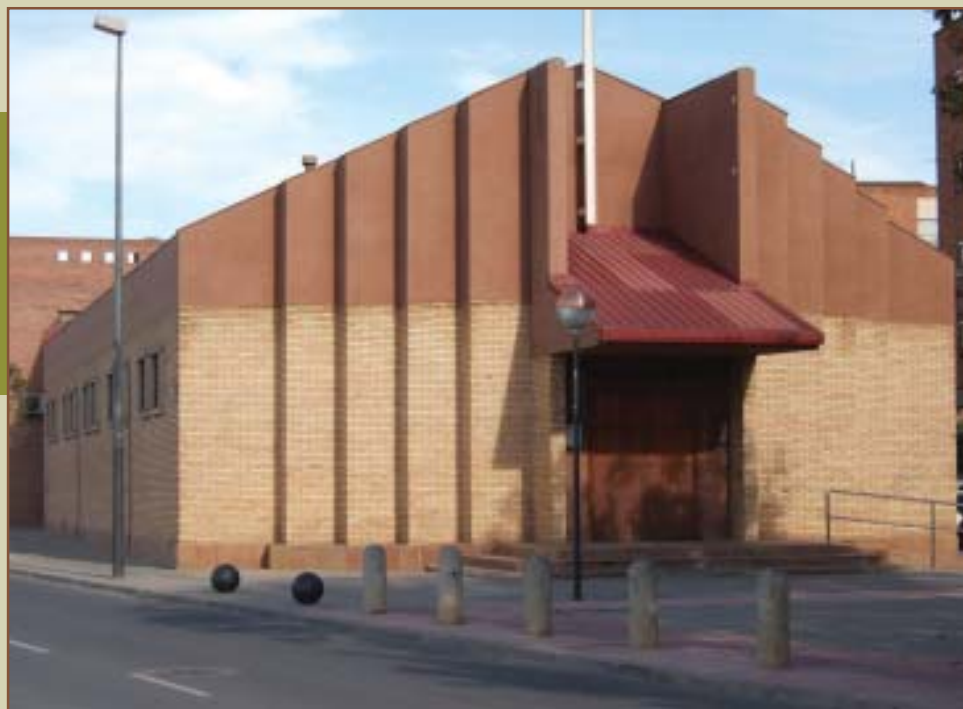
Parròquia de la Verge dels Pobres al Secà de Sant Pere.

precaris per a poder construir l'edifici de nova planta que es precisava. Únicament es comptava amb la donació d'un petit terreny que havia fet la coneguda família Delmàs. Malgrat tot, la il·lusió i coratge del rector van atreure ben aviat l'interès de la bona gent del barri a fer causa comuna en aquella costosa tasca. El barri havia sorgit del no-res, fruit de la immigració d'algunes famílies de la Ribagorça i, sobretot d'Andalusia i Extremadura. Gent molt humil, la major part, però que van obrir el seu cor a cooperar amb «er monce», com nomenaven al mossèn alguns feligresos