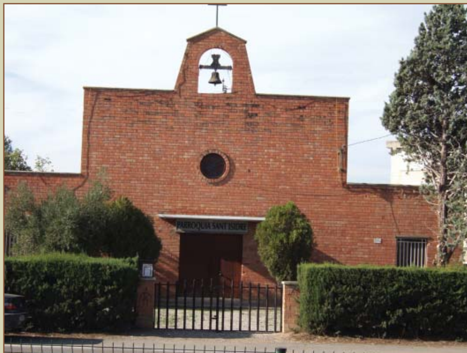
Parròquia de Sant Isidre Llaurador.

d'origen andalús. I al igual que moltes gotes de cera fan tot un ciri pasqual, també amb moltes petites aportacions es va anar bastint l'edifici de la Parròquia.