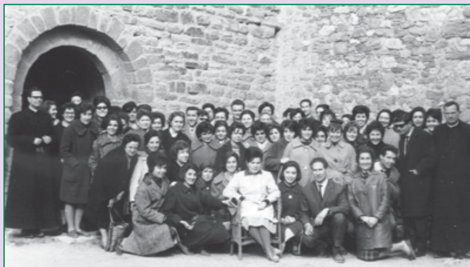
Trobada d'Isard a Moror.

Fruit del dinamisme de la seva tasca docent eren els contactes dels seus alumnes amb el magisteri jove que ja exercia en pobles rurals. Hom recorda, a tall d'exemple, una memorable trobada d'estudiants i mestres del grup Isard a Moror, petit poble ben proper a l'esquena del Montsec. L'autocar amb que viatjaren els 35 futurs mestres no podia passar per un carrer de Guàrdia de Noguera i calgué fer transbordament a un camió per als darrers quilòmetres del viatge. El fred d'aquell 24 de febrer de 1962 fou neutralitzat amb els alegres cants dels joves. En aquella reunió es crearen vincles d'amistat entre mestres i estudiants que es transmeteren, mútuament,