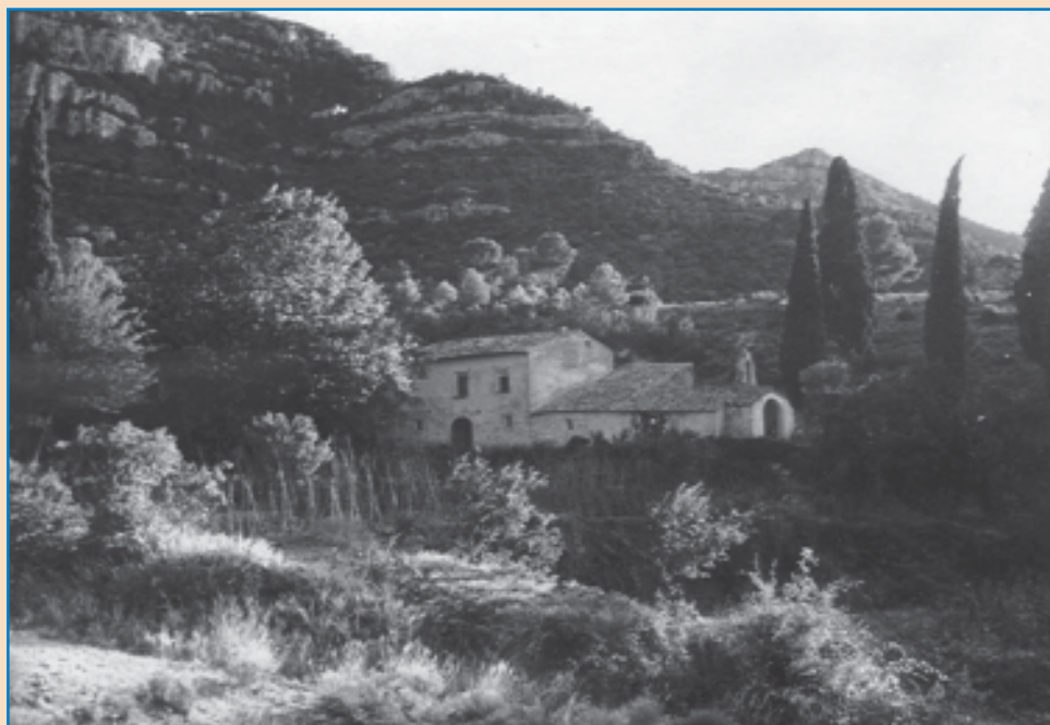
Colònia Montsant d'Ulldemolins.