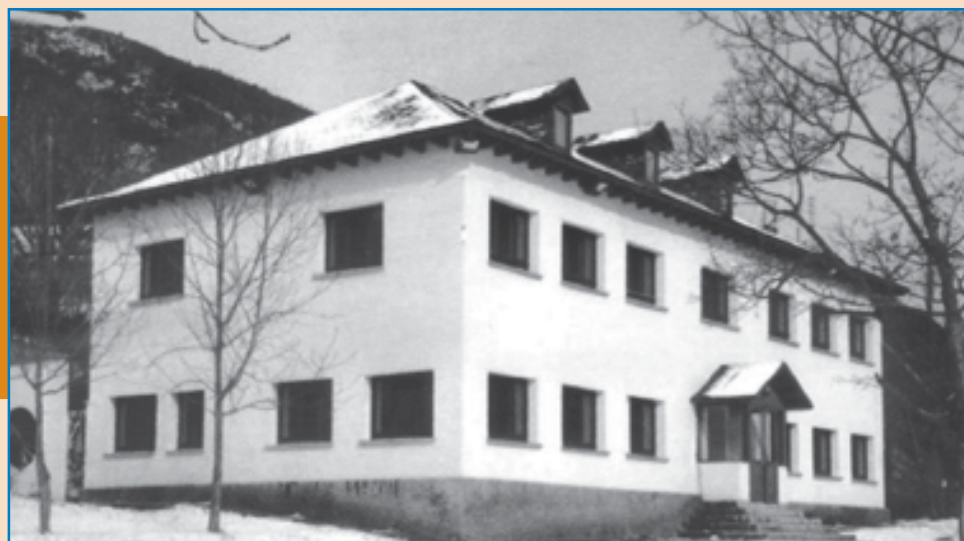
Colònia Verge Blanca de Llesp.