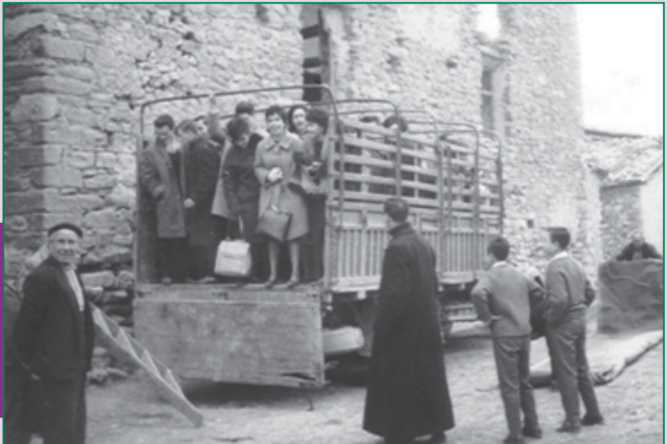
Estudiants de Magisteri viatjant a Moror.