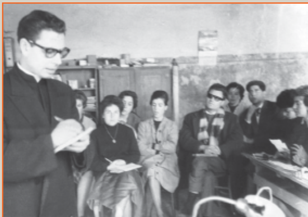
En una de les convivències celebrada a l'Escola de Mont-ros.

seves col·laboracions a la revista que el grup editava foren un puntal ferm que contribuï a anar forjant la mística d'aquell moviment. Unes pinzellades extretes dels trenta números que va donar a llum la revista