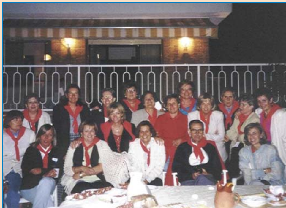
En la trobada amb les «Monitores ahir, avui i sempre».