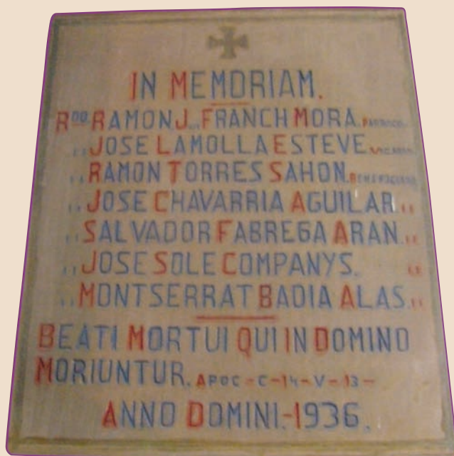
làpida que es conserva a la capella del Santíssim del Carme.

El juliol de 1936, en iniciar-se la persecució religiosa, no es trobava a Lleida; es trobava a Barcelona. S'hi quedà, allotjant-se en una pensió on no fou molestat, tot i que es coneixia la seva identitat. A la fi, delatat i identificat com a sacerdot, fou detingut el 12 de setembre. El mateix dia el seu cadàver ingressà al cementiri de Barcelona, sense que es coneguïn els detalls ni circumstàncies de la seva mort.