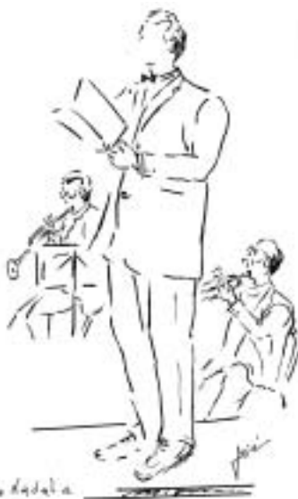
Concert de Nadal a 28 de desembre 2008

"Tralla de llum, alegria secreta. Endevinem avui aquell róssec borrós dels àngels en la nit i un estel vermellós, roent com les paraules de Joan, el profeta."