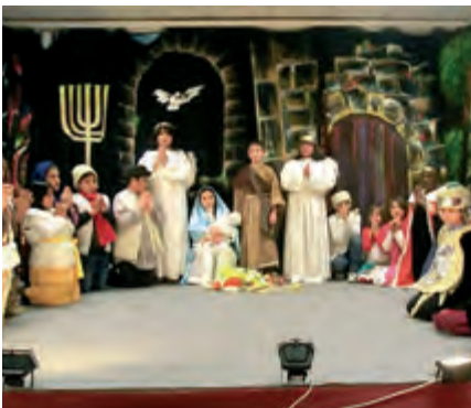
Els pastorets infantils