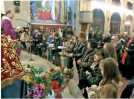
Benedicció de Jesusets del pessebre