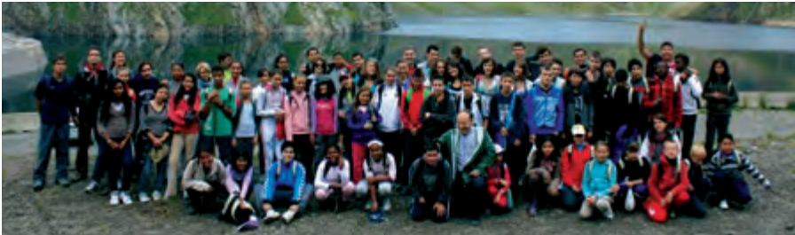
Campaments l'Estel: Units per la fe, l'amor un esforç en comú