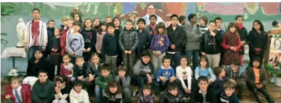
Trobada arxiprestal de catequesi a Santa Maria Magdalena