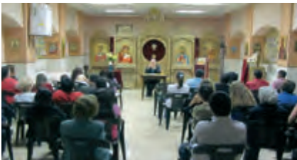
Aspectes educatius de la família, conferència de Mn. Joan en la Setmana de la Família