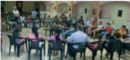
Inici de curs de Catequesi