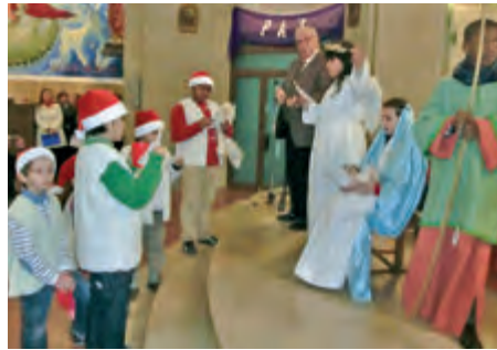
Ofrena de pastors el dia de Nadal