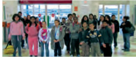
Travessa per l'obaga del Montsec