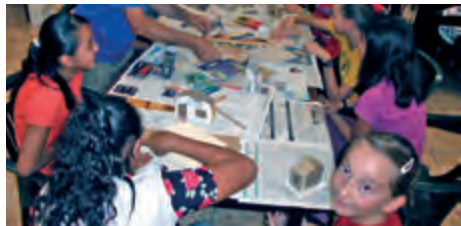
L'Esplai de vacances