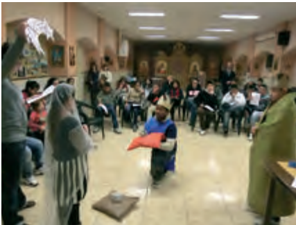
Minifestival de Nadal