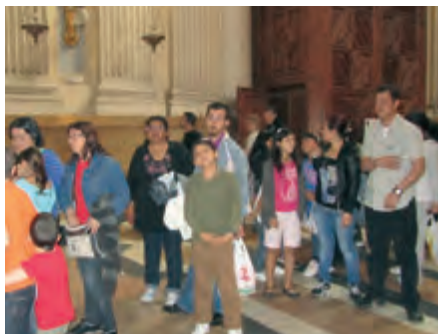
Un dia deliciós a Saragossa: Catequesi amb la Mare de Déu del Pilar