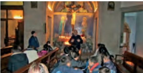
Celebració de la Candelaria i inici catequètic de Quaresma davant del Crist del Sant Crucifix i celebració del "Dimarts" de Cendra