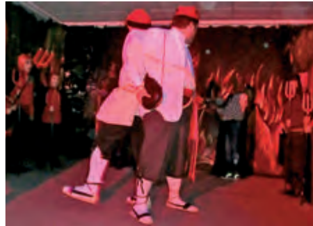
Grup de dimoniets al "Borrego i Carquinyoli"