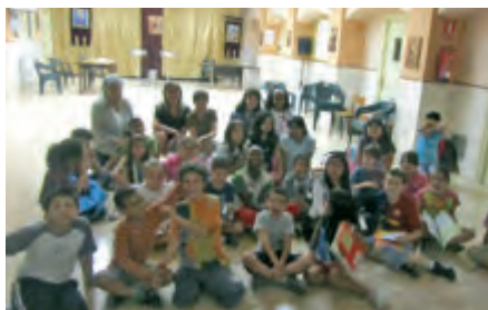
Premi del Concurs Bíblic al grup de catequesi parroquial: "La Bíblia, Font de Valors Humans i Socials"