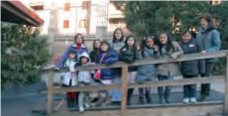
Oceania en la Fira de Infància Missionera, al Col·legi Dominiques de l'Anunciata