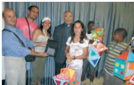
Premi al Carne en el Concurs de Fanalets de Sant Jaume