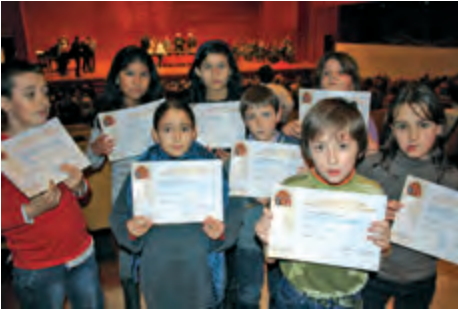
Lliurament de Premis del Concurs de Pessebres