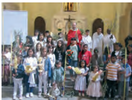
Diumenge de Rams a Sant Joan