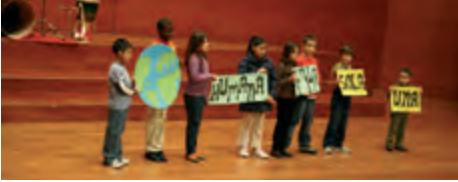
Festival folklòric de la jornada mundial de les migracions