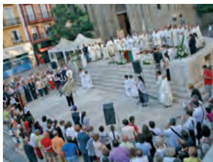
Corpus Christi: el Cos de Jesús pel cor de la ciutat