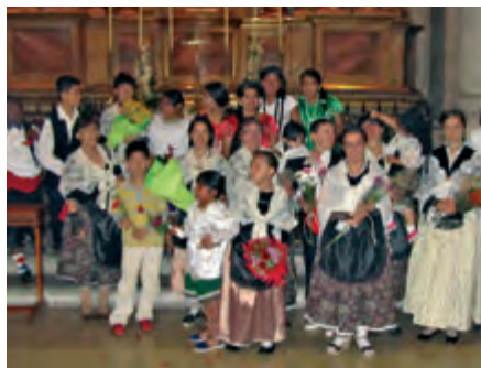
Ofrena floral a Sant Anastasi