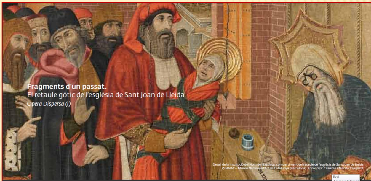
Fragments d'un passat. El retaule gòtic de l'església de Sant Joan de Lleida Opera Dispersa (I)

Detall de la Inscripció del Nom del Baptista, compartiment del retaule de l'església de Sant Joan de Lleida