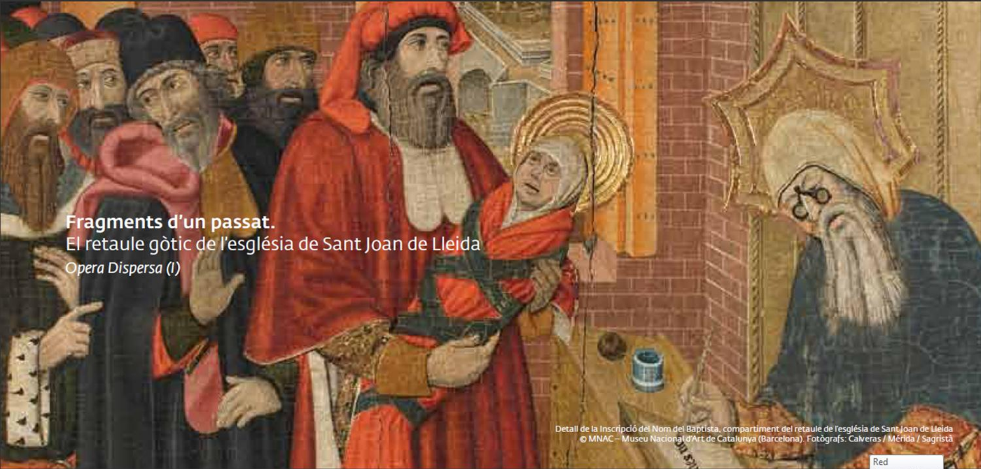
Fragments d'un passat. El retaule gòtic de l'església de Sant Joan de Lleida Opera Dispersa (I)

Detall de la Inscripció del Nom del Baptista, compartiment del retaule de l'església de Sant Joan de Lleida