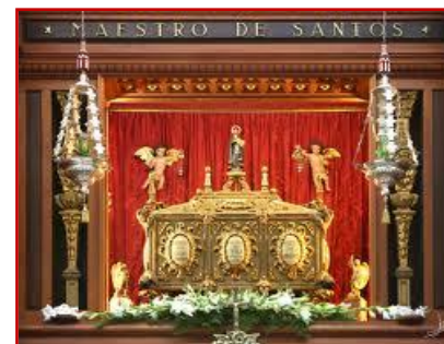
Sepulcro de San Juan de Avila. Iglesia de la Encarnación de Montilla

Ávila fue mi nombre, mi camino, la tierra en que pisaba peregrino. El cielo era mi patria verdadera. ¿Qué oficio ejercité? Segador era; de la incansable mano nunca dejé la hoz por muy anciano, antes a Cristo di siempre constante cosecha de sus mieses abundante.